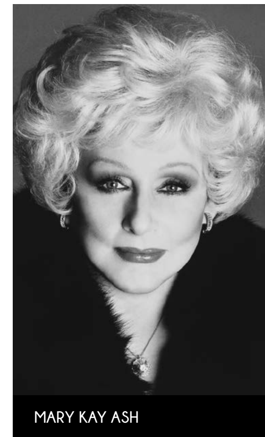
MARY KAY ASH

Mary Kay na Slovensku podporuje už niekoľko rokov Svetový deň darcov krvi a minulý rok v júni sa zamestnanci spoločnosti pridali k dobrovoľníkom, ktorí v Bratislave a Komárne čistili oblasti postihnuté povodňami. Mary Kay myslí aj na prírodu. Minulý rok po prvýkrát zorganizovala v ČR i SR, v rámci projektu „Myslite ružovo, konajte zelené“, výsadbu stromov v chránenej krajinskej oblasti Dunajské Luhy, a podieľala sa tak na zveľadení nášho životného prostredia. V neposlednom rade sa Mary Kay zapája aj do zbierania vrchnákov na charitatívne účely. Medzi pravidelné dobročinné aktivity patria aj maratóny a polmaratóny, ktorých sa zúčastňujú zamestnanci spoločnosti Mary Kay v ČR a SR. Aj vďaka behaniu možno prispieť na charitatívne účely.