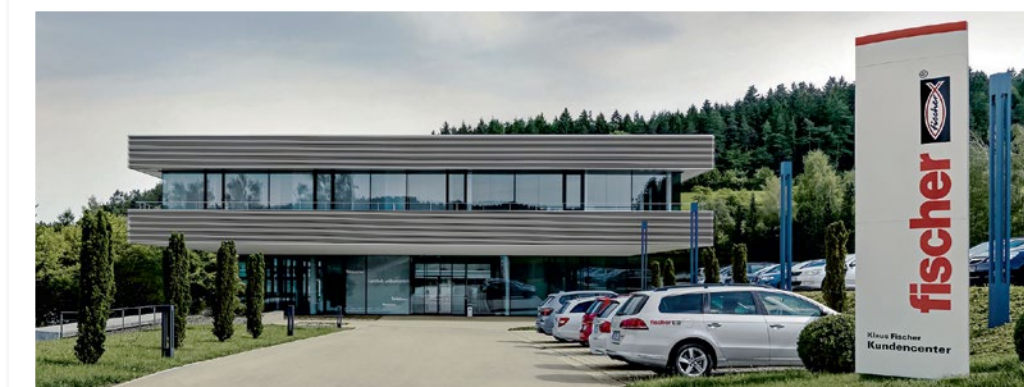
Centrála spoločnosti fischer vo Waldachtal-Tumlingen